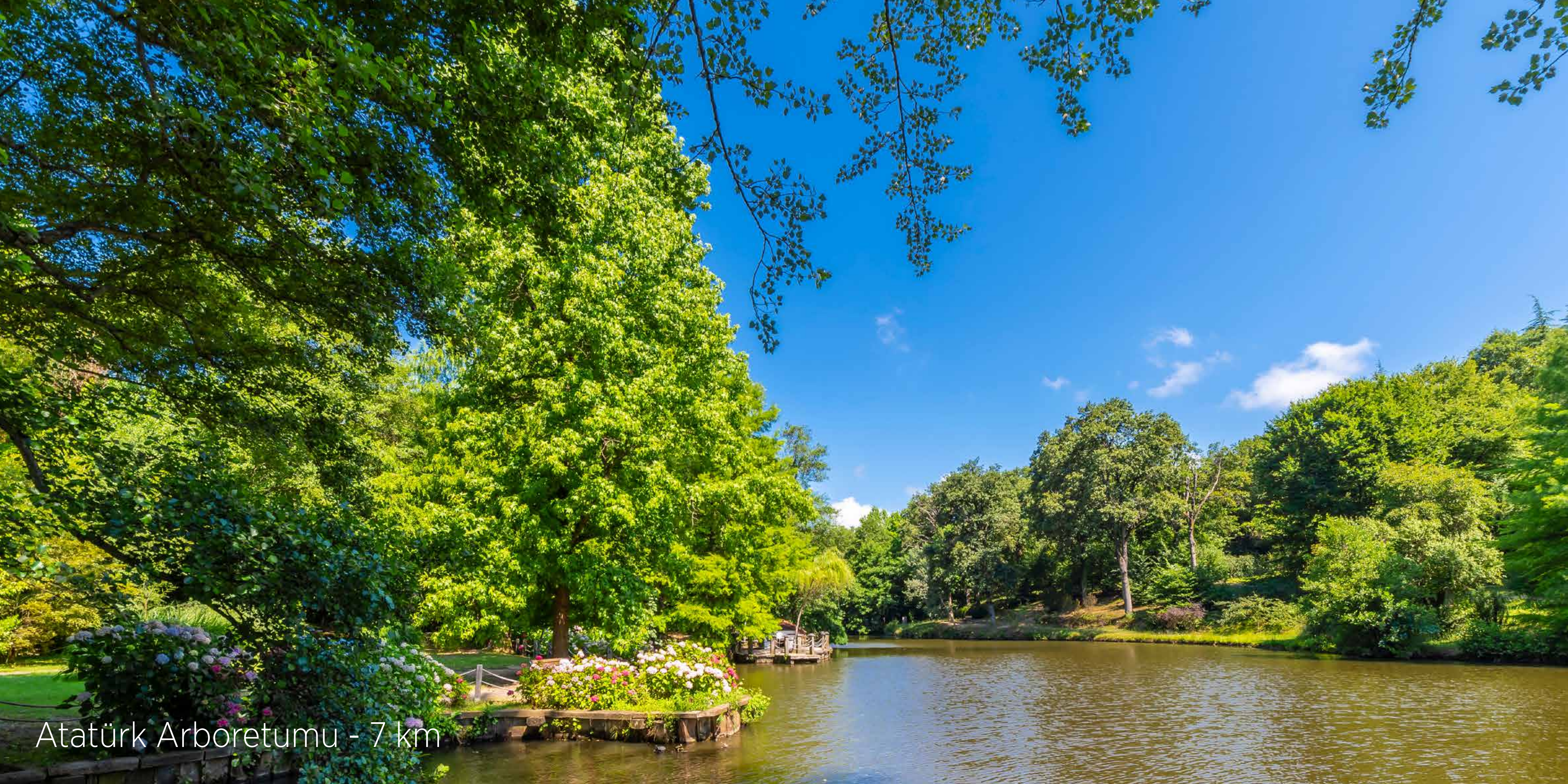
Atatürk Arboretumu - 7 km